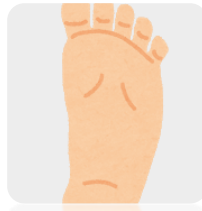
足底筋膜炎、糖尿病足